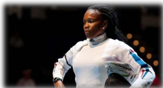
Ci-dessus, Laura Flessel-Colovic aux JO de 2012